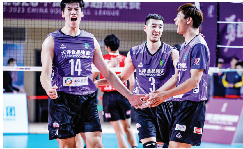
分,天津队以15:13赢下制胜一局。

男单半决赛中,日本球员张本智和以4:0战胜德国老将奥恰洛夫。马龙在0:3落后的情况下,以11:9、11:7、13:11连扳3局,但在决胜局中以8:11告负,最终以3:4惜败于王楚钦。决赛中,王楚钦将迎战张本智和,这将是继成都世乒赛男团半决赛后二人再度交手。