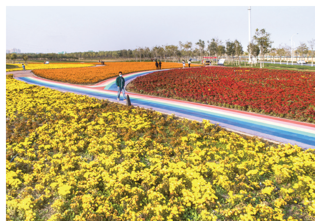
日前,天津港保税区空港七彩花田打造全新花海景观,50余万盆时令花卉争奇斗艳,增加了观赏效果,带来了秋日的浪漫。

习近平总书记在党的二十大报告中深刻阐述了中国式现代化的中国特色和本质要求。我们要深刻认识到,中国式现代化,是中国共产党领导的社会主义现代化,既有各国现代化的共同特征,更有基于自己国情的中国特色。这是人口规模巨大的现代化,我国十四亿多人口整体迈进现代化社会,规模超过现有发达国家人口的总和,艰巨性和复杂性前所未有,我们坚持稳中求进、循序渐进、持续推进,这是全体人民共同富裕的现代化,共同富裕是中国特色社会主义的本质要求,我们坚持把实现人民对美好生活的向往作为现代化建设的出发点和落脚点;这是物质文明和精神文明相协调的现代化,物质富足、精神富有是社会主义现代化的根本要求,我们不断促进物的全面丰富和人的全面发展; (下转第2版)