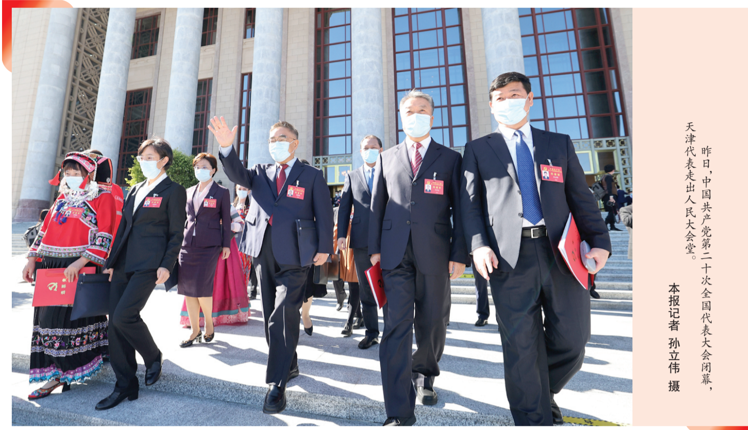
昨日,中国共产党第二十次全国代表大会闭幕,天津代表走出人民大会堂。