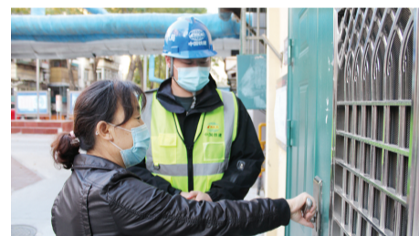
中铁十八局集团2022年老旧小区改造项目职工,按照党的二十大精神报告提出的要求,立足群众需求,为人民美好生活添砖加瓦。图为中铁十八局集团职工听取居民对改造工程的意见建议。

“2019年1月17日,习近平总书记视察天津时,我曾在现场向总书记汇报了我們研发的配网带电作业机器人第二代,总书记夸奖我们职工创新团队‘实践出真知’。”回忆起当时温暖的场景,张黎明自豪感油然而生,他说,只要是能够保证一线工人人身安全的工作经验和技巧,攻克了万伏电压下机械臂的绝缘和电磁干扰的难题,研发了全自主的配网带电作业机器人,在全国20个省份推广应用,并实际替代人工作业17000多次。