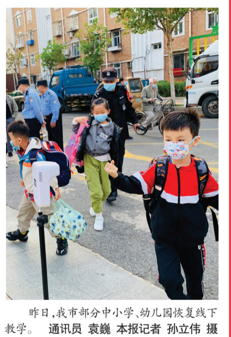
昨日,我市部分中小学、幼儿园恢复线下教学。