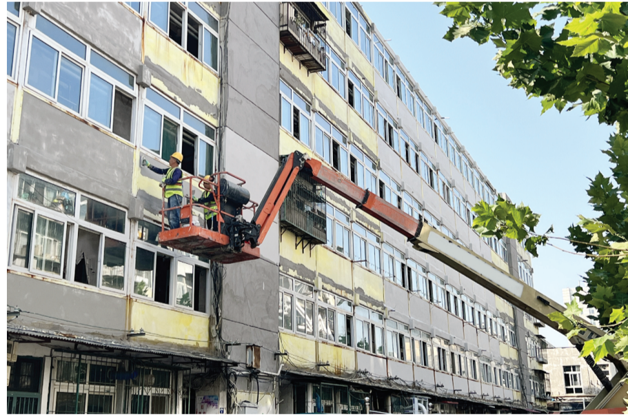
连日来,北辰区集贤里街道持续推进老旧小区改造工作,主要包括对楼顶防水进行修复、增设外保温层、粉刷楼体外立面等,提高建筑保温性能和居住舒适度。图为北辰区鹿林里社区进行旧楼改造。

越来越多的居民乐于在文化消费上增加支出。2019年我市居民人均用于文化方面的消费支出达到3584元,比2012年增长1.3倍;文化消费占生活消费总支出的比重升至11.3%,比2012年提高2.8个百分点。在居民文化消费大幅增长的带动下,2021年全市规模以上文化及相关产业企业实现营业收入1701.11亿元。国家统计局天津调查总队显示,我市居民对文化建设、民心工程建设的满意度高达97.1%。