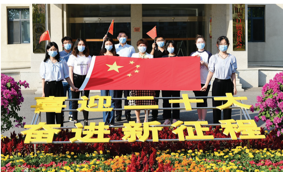
连日来,西青区辛口镇喜庆气氛浓郁。图为街镇党员和工作人员与“喜迎二十大 奋进新征程”主题景观同框合影。