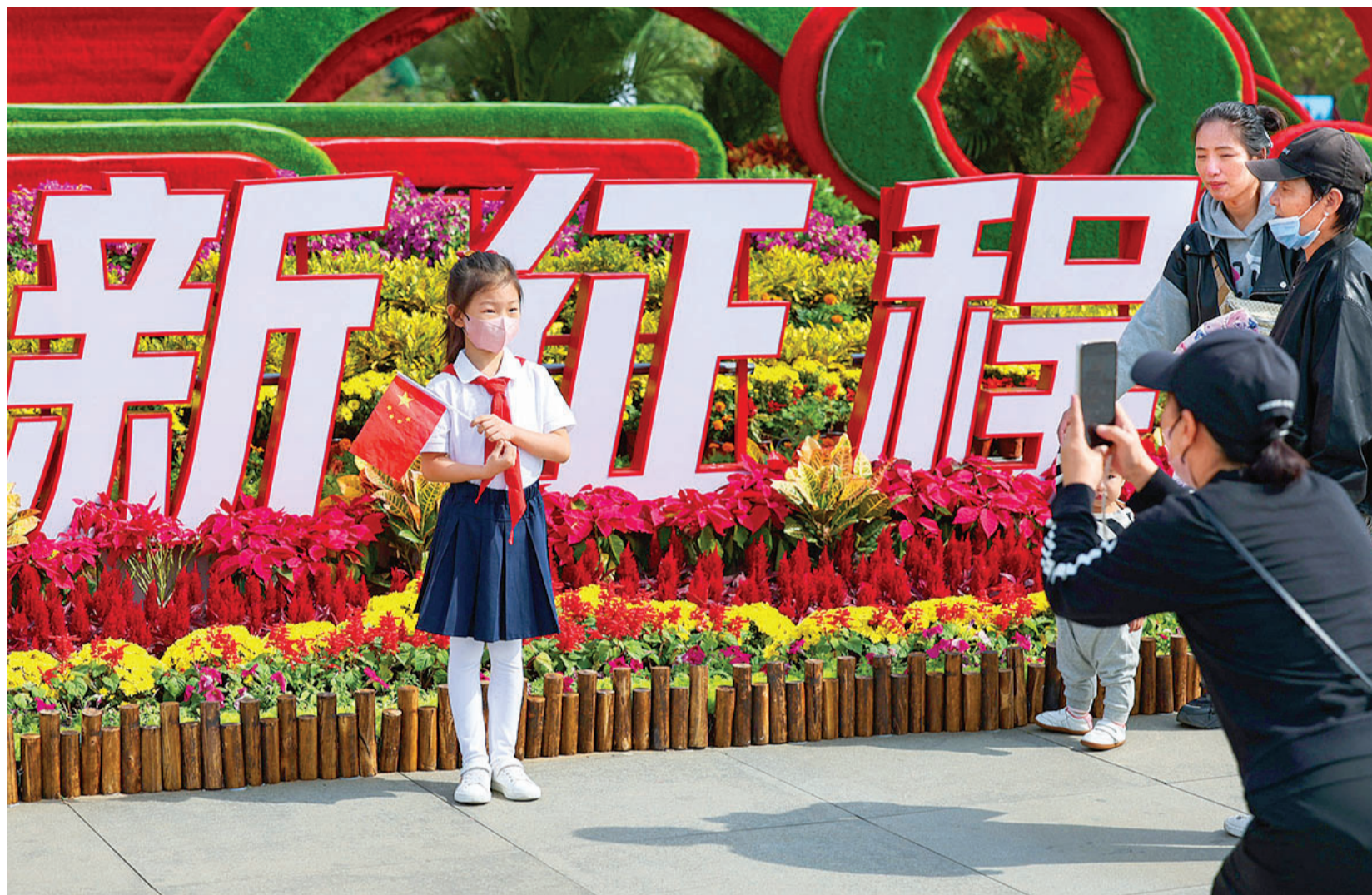
文化中心“欢度国庆 喜迎党的二十大”主题景观前留影。