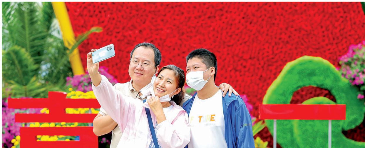
水上公园里留下喜庆全家福。