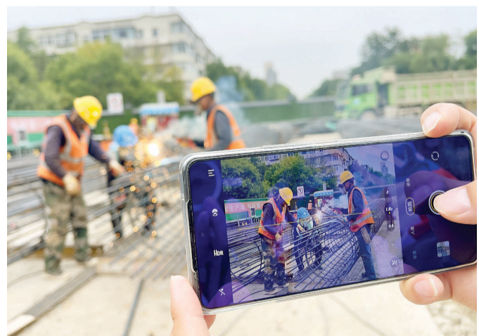
国庆假期,中建五局施工人员用手机记录下了同事们坚守一线的场景。