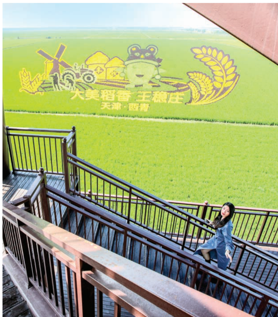
西青区王稳庄丰收塔上,稻田画尽收眼底,成为游客拍照取景的胜地。