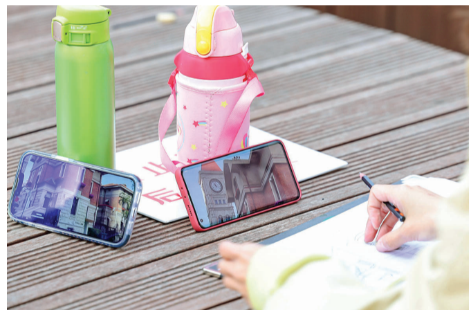
用画笔记录城市美景。