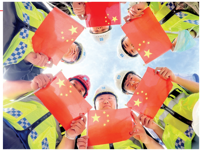
国庆节,中建三局天津地铁7号线工程,职工与国旗同框为祖国祝福。