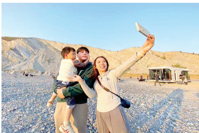
国庆假期,蓟州区春山里矿坑崖壁吸引了众多游客打卡拍照。