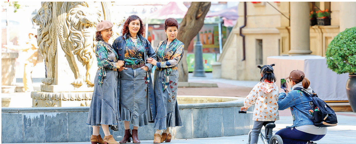
意风区打卡拍照,感受异域风情。