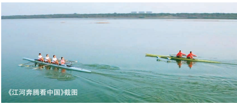
《江河奔腾看中国》截图

《江河奔腾看中国》自10月1日至7日播出,选取长江、黄河、松花江、辽河、淮河、珠江、闽江、塔里木河、万泉河以及京杭大运河等江河,着力展现江河奔腾、川流不息的壮丽自然画卷,日新月异、蒸蒸日上、安居乐业的百姓生活图景,以江