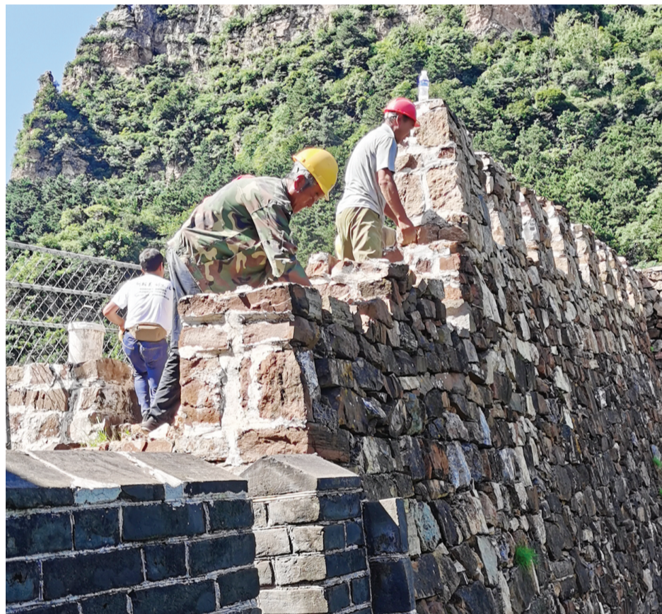
蓟州区对黄崖关长城自然受损墙体进行修缮。