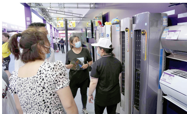
消费品下乡巡回展受到周边居民欢迎。