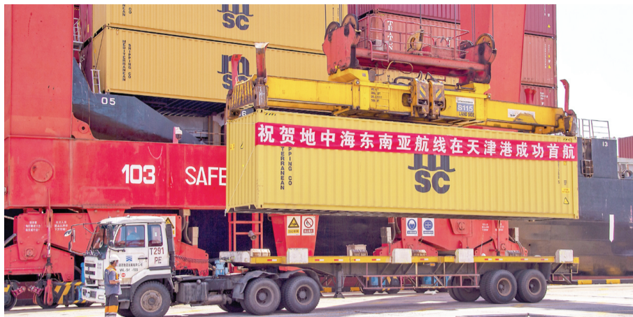
7月23日开通的地中海东南亚航线。

今年,随着区域全面经济伙伴关系协定(RCEP)正式生效,天津港充分发挥“一带一路”海陆交汇点和服务全面对外开放国际枢纽港作用,与菲律宾、泰国、新加坡、越南、缅甸等RCEP有关国家的集装箱运输量同比增长了7%以上,并成功开通了至澳大利亚、东南亚等7条外贸远洋航