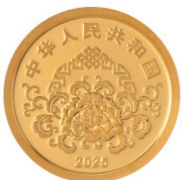
1克圆形普制金质纪念币正面图案