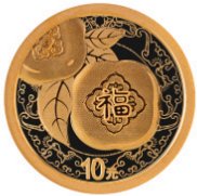
1克圆形普制金质纪念币背面图案