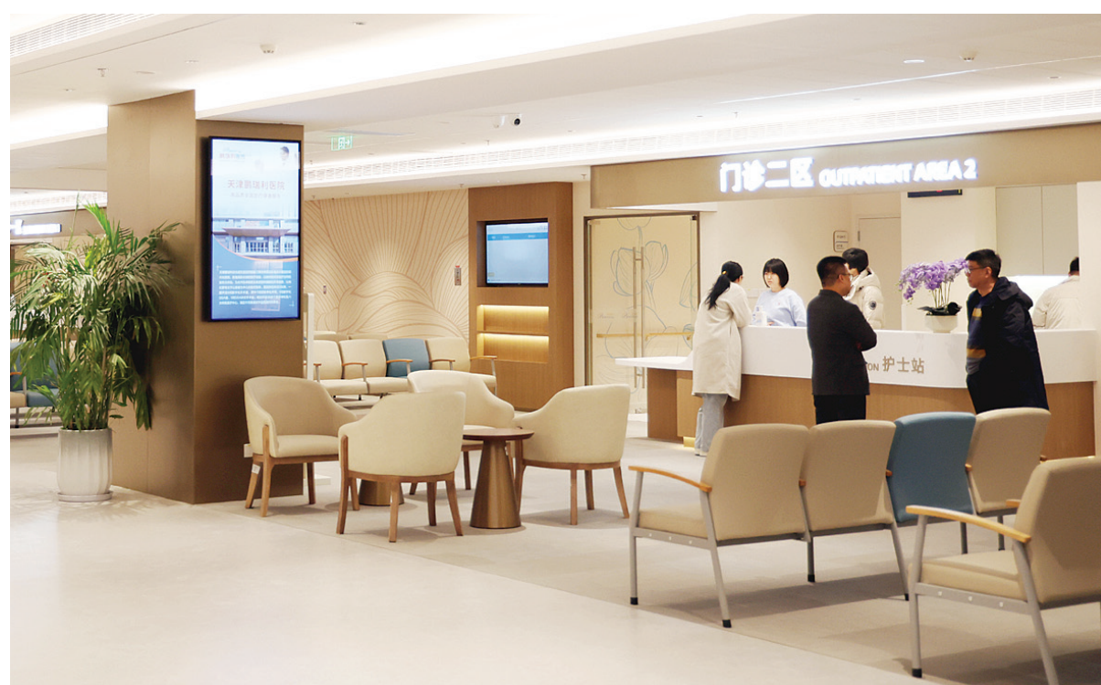
本组摄影 新报记者 王倩 通讯员 翟丽丽

昨日，天津市颁发第一张外商独资三级综合医院医疗机构执业许可证，成为2024年9月7日国家三部委发布《关于在医疗领域开展扩大开放试点工作的通知》以来，首家获批的外商独资三级综合医院。