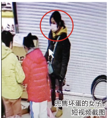
兜售坏蛋的女子。 短视频截图

何大姐也想提醒大家，千万不要贪图便宜，更不能轻信这些骗子的花言巧语。购买商品还是应该到有营业执照的固定摊点，一旦发现问题，也能及时维权。 新报记者 崔楠