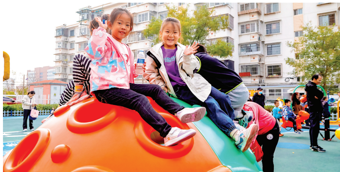
今年,津南区启动“三微四景”项目,即通过“微改造、微更新、微提升”,打造更多“经济发展场景、便民服务场景、公共文化场景、文明实践场景”。图为津南咸水沽镇永安里社区打造的综合性微广场近日正式投入使用。