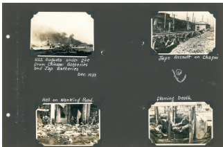
1937年日军轰炸上海，相册中的这一页被称为“地狱般的南京路”。