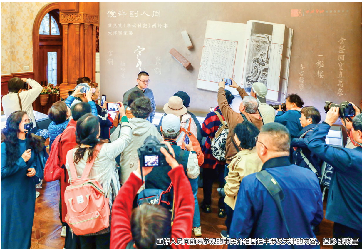
工作人员向前来参观的市民介绍日记中涉及天津的内容。