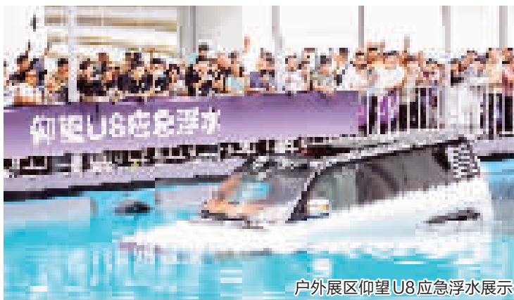
户外展区仰望U8应急浮水展示

责人表示,根据车型的不同,消费者在津南区购买该品牌的车辆,可以领取1500元至3500元不等的消费券,这一鼓励政策激发了市场的购车热情,相关门店销售额实现了大幅提升。