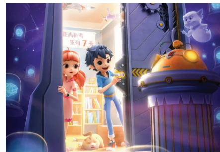
《皮皮鲁和鲁西西之309暗室》

知名动画IP的大电影版此次进军国庆档,延续了该系列一贯的温馨家庭风格,讲述了大头儿子和小头爸爸意外变小后,在现实世界中与新伙伴们一同面对危机、克服困难的成长冒险。影片寓教于乐,以亲子间的互动与合作为主题,传递了爱与勇气的价值观,是国庆期间典型的合家欢电影。