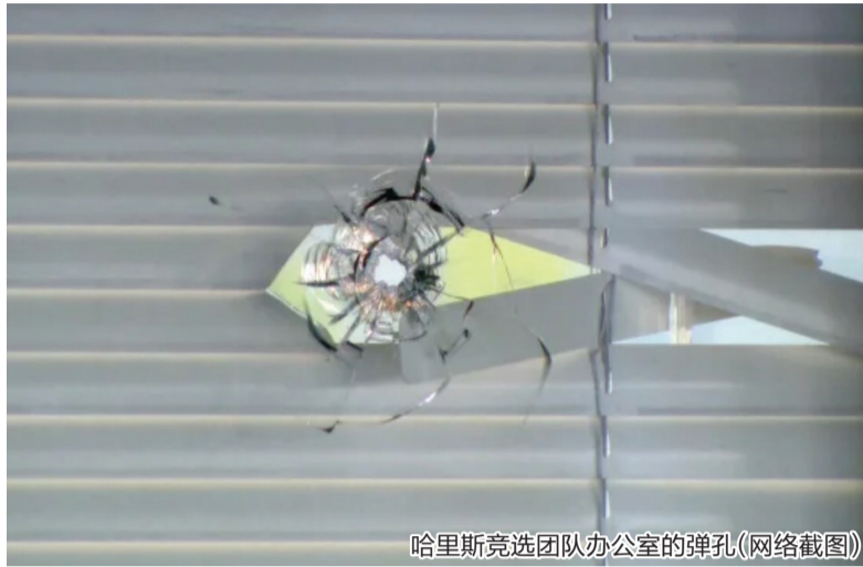
哈里斯竞选团队办公室的弹孔

检方16日对劳思提出两项罪名指控,一项是有重罪案底却非法持枪,另一项是持有序列号被抹掉的枪支。特