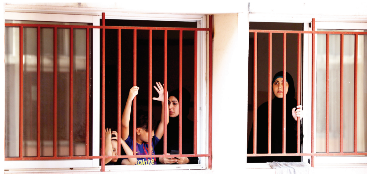
以色列空袭黎巴嫩致大量民众流离失所。

天局发布的卫星追踪信息报道,以色列23日对黎巴嫩南部空袭面积覆盖1700多平方公里。这份报告由“消防信息资源管理系统”生成,通常用来追踪野火火情,也能用来观察空袭后起火点分布。