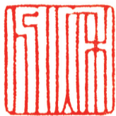
一秋分 王少杰 刻铜一