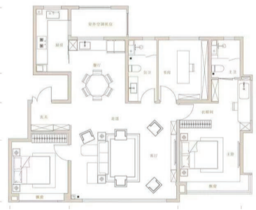
河西区新房源户型

约130平方米更新迭代升级产品,搭配当下流行的落地窗、大宽厅。产品由14—17到顶小高层、8层到顶洋房组成,一梯两户,洋房一层带有小院,户型建筑面积约103—143平方米。项目拥有多条公交线路和地铁11号线、6号线,享有优质的教育资源,辐射多所幼儿园。