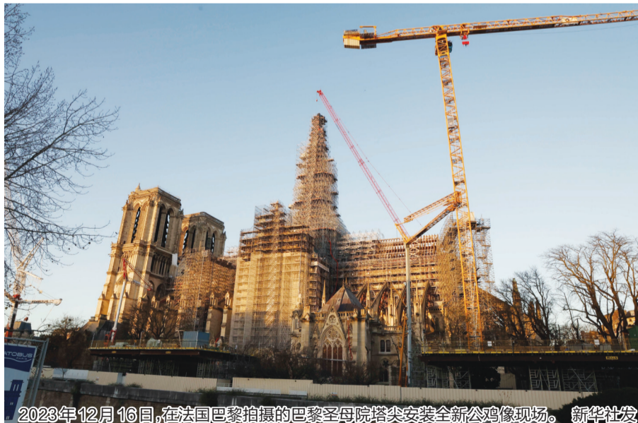
2023年12月16日，在法国巴黎拍摄的巴黎圣母院塔尖安装全新公鸡像现场。

法国RCF广播电台11日报道称，巴黎圣母院在经历大火摧毁与漫长的修复后，将于今年12月8日重新对外开放。圣母院的修复情况以及后续的参观安排，引起了民众的高度关注。