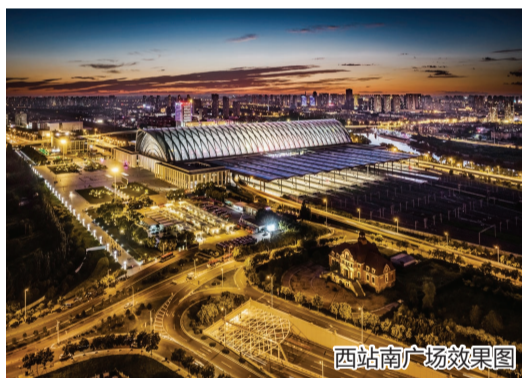
西西南广场效果图