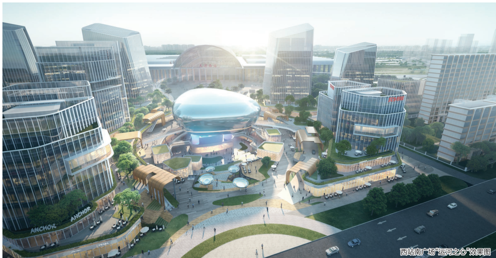
西西南广场“运河之心”效果图