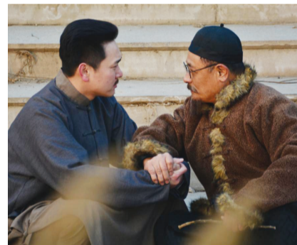
电影中的严修与张伯苓