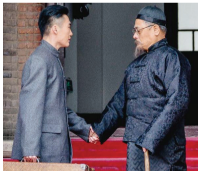
电影中的严修与周恩来