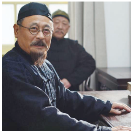
电影《一代人师严修》剧照