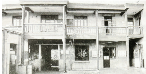
拆除前的严修旧居局部。