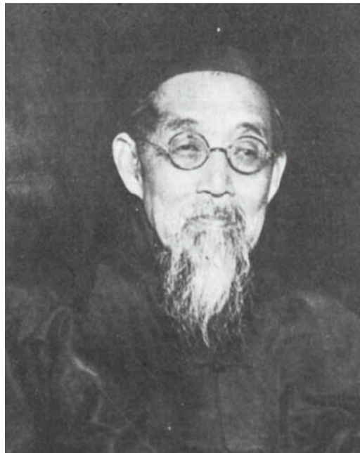
南开学校介绍册、毕业纪念册上的严修像。资料图片