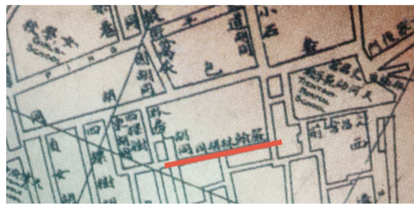
地图上标注的“严翰林胡同”。

在时代大潮中,以旧学为基础的严修,积极倡导新学。为官期间,严修奏请光绪帝开设“经济特科”借以改革科举制度,得罪了主考官徐桐,贵州学政任满后不再被朝廷重用,1898年他回到天津。