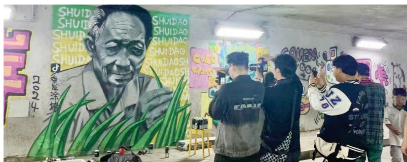
在白方礼和袁隆平涂鸦肖像前聚集着大批年轻人