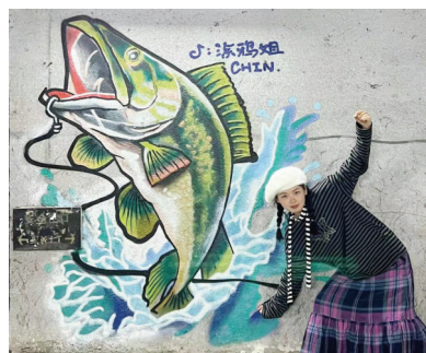
涂鸦姐和她的作品