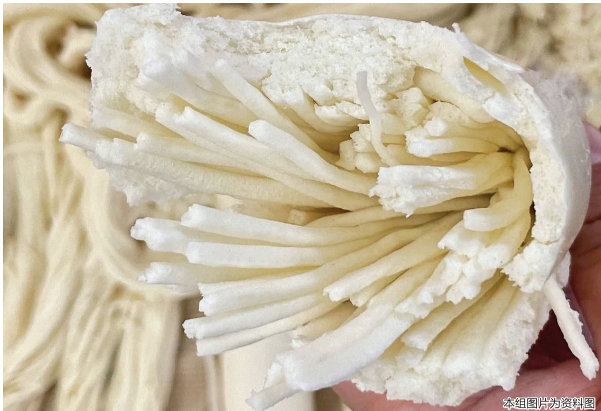
本组图片为资料图