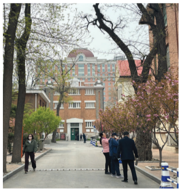
北疆博物院展览厅