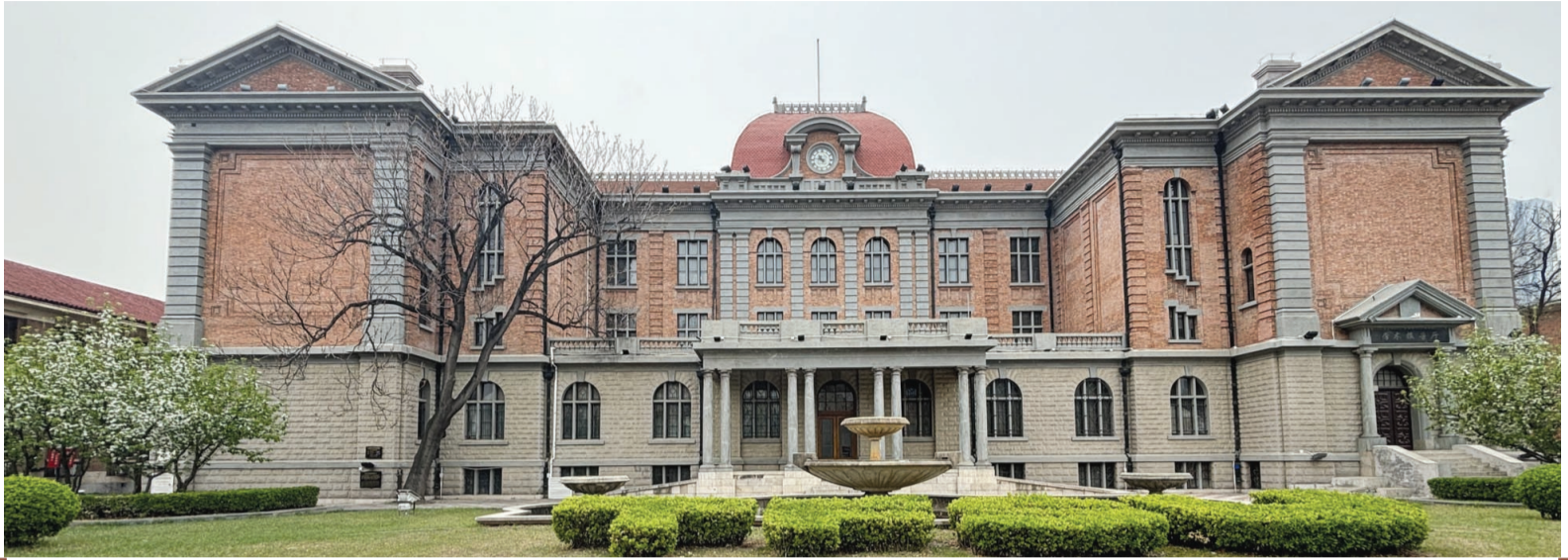
有着“科学与哲学的完美融合”之称的钟楼