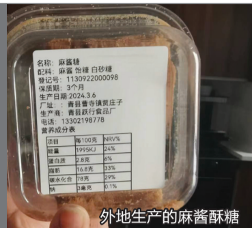
外地生产的麻酱酥糖

随着短视频平台被越来越多的受众接受,从短视频平台购物也成了很多消费者的日常消费习惯之一。而在3·15前夕,本报会同市场监管部门对抖音平台上销售的糕点进行调查,诸如平台标注生产厂家与实际生产厂家不符、众多外地厂家生产的产品也被冠上“天津特产”幌子的现象比比皆是。更有甚者,一些主播公然诋毁其他商家的现象也在平台上出现。