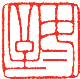
—冬至 王少杰 刻铜—