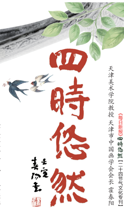
天津美术学院教授 天津市中国画学会会长 霍春雨

九九消寒期间中国民间风俗有制九九消寒图，写九九歌，写九九对联等消寒活动，择“九”日，相约九人饮酒(“酒”与“九”谐音)，席上用九碟九碗，成桌者用“花九