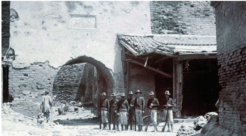
天津老城南门旧影

实际上,这“几大开”并非都以老城作为“坐标原点”,甚至地理位置还发生动态变化。而这些,恰恰就是天津在历史洪流中不断前行的缩影,形成了天津城市不可磨灭的时代记忆。