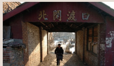
北开渡口(2007年1月17日)