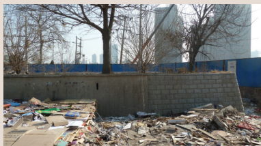
北开的南炮台遗址旧影

京韵大鼓的前身是发源于河北的木板大鼓,并在道光、咸丰年间传到天津,早期木板大鼓艺人宋五、胡十、霍明亮等都曾在北开“破烂市”撂地,他们在演出的过程中借鉴了天津人的吐字和北京官话的发音,发展成为“大鼓书”“怯大鼓”阶段,按照《中国曲艺志 天津卷》的记载,在此基础上,“鼓界大王”刘宝全也是在北开撂地起家,集三家所长,并以京音为基础设计唱腔,在甩板时保留天津口音。京韵大鼓的一系列曾用名,直接和天津相关的就有卫调大鼓、津音大鼓、津韵大鼓、天津大鼓等。现在,越来越多的学者倾向于京韵大鼓形成于天津,后传入北京才有其名。可以说,北开明