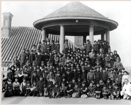
日租界芙蓉小学在宁家大院屋顶花园合影