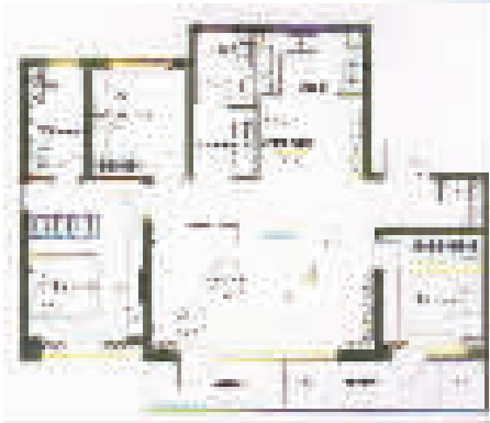
景,酒店级主卧套房,宽境大飘窗给生活增添奢华与潮流色彩。 杨翔云/文

约143平方米三室两厅两卫,约6.5米的横厅尺度设计,大尺度阳台尽览专属的湖居景致,复合功能空间营造了多样化的生活场