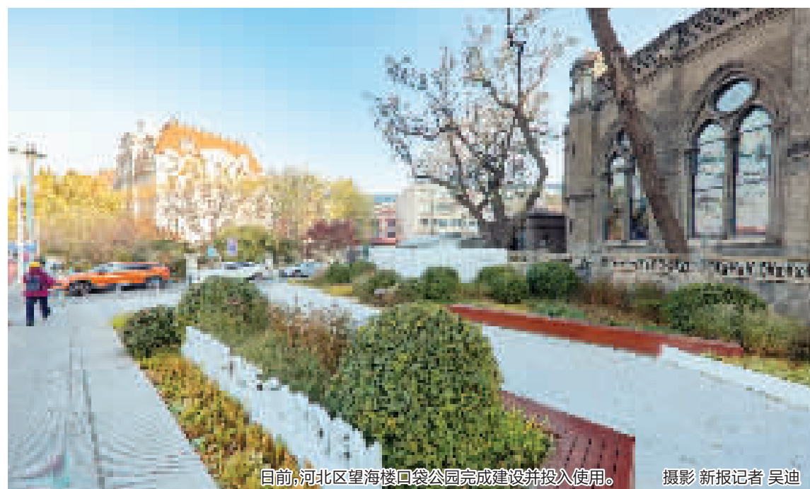
目前,河北区望海楼口袋公园完成建设并投入使用。