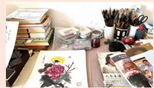
于淑珍创作的国画