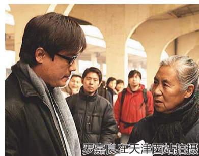
罗嘉良在天津西站拍摄