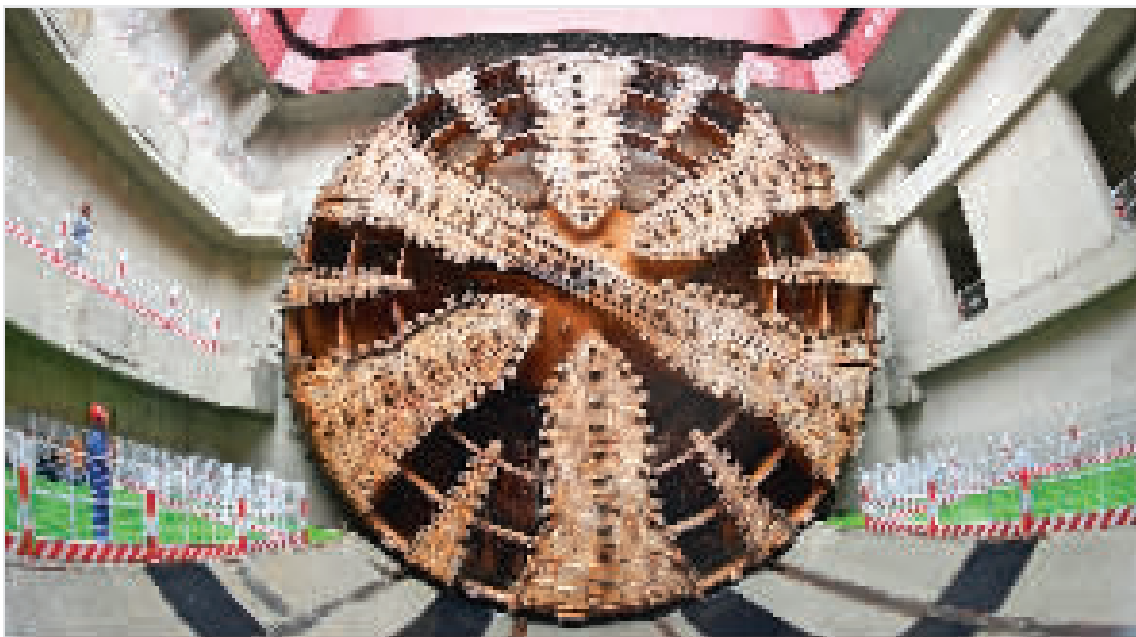
6月28日，国产最大直径盾构机——“京华号”盾构机出洞，由中铁十四局承建的北京东六环改造工程西线隧道顺利贯通。