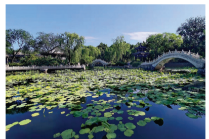
@非常道 6月8日拍摄于西沽公园