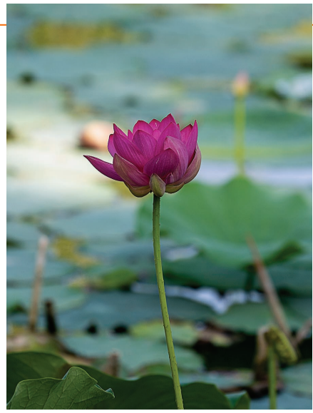
拍摄于长虹生态园 林萍 6月7日