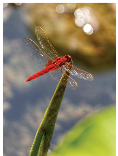
姜洪新 6月7日 拍摄于水上公园