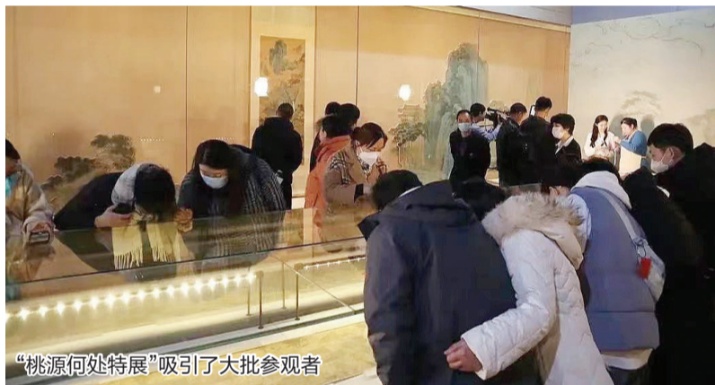
“桃源何处特展”吸引了大批参观者

《金明池争标图册》描绘了北宋都城汴梁（今河南开封）御苑金明池龙舟争标的场景，楼台、亭榭、桥梁、龙舟小艇及众多人物会聚图上，人物虽微小，但比例恰当，姿态各异，栩栩如生。在“明池夺标”互动游戏体验区，参观者可以通过手机扫描二维码参与互动，