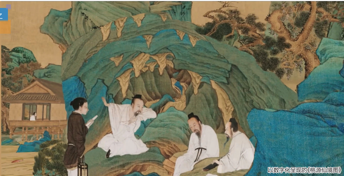
以数字化呈现的《桃源仙境图》

除了现场感知和体验真的文物，以数字化的形式延伸文物的内涵，建立起文物和观众之间的桥梁，将帮助历史和文化穿越时空，和现代人实现心灵的互通。近年来，津城博物馆正在以数字化实现进阶，观众穿梭于虚拟环境与真实世界之间，文物也因此“活”了起来。