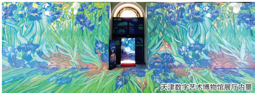
天津数字艺术博物馆展厅内景