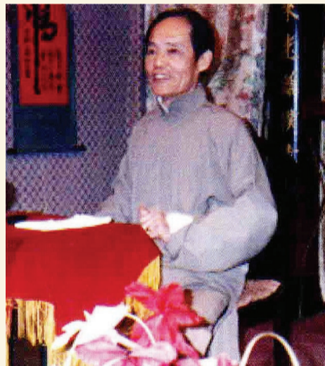
评书大家刘立福先生