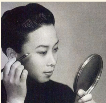
尹桂芳《秋海棠》剧照