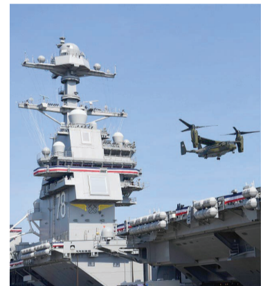
“福特”号航母