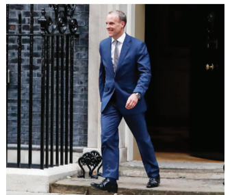
2021年9月15日，新任命英国副首相兼司法大臣拉布离开英国伦敦的唐宁街10号首相府。