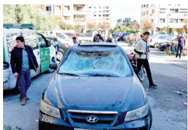
2月19日，叙利亚大马士革，导弹袭击中受损的车辆。

据美联社报道，美军23日空袭叙利亚东部代尔祖尔省3处地点。美国总统约瑟夫·拜登在空袭后说，美国将“采取强有力的行动”保护美方人员。