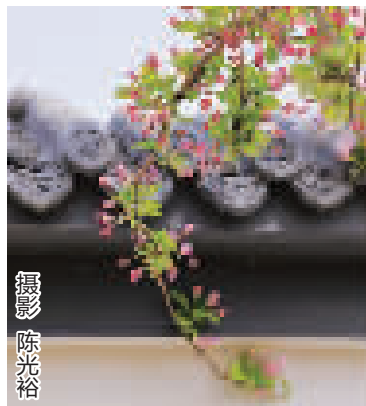
百年前的天津花园洋房里,争春的还有海棠。