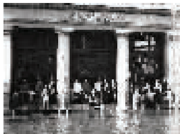
1939年中原公司遭遇水灾

也被浸泡超过一个月而歇业，损失颇大。水灾之后的转年，大楼又遭遇了一场罕见的火灾，整个商场元气大伤，逐渐无以为继。