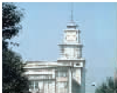
天津百货大楼的大钟表逐渐变化

网友@笠还记得，当年天津百货大楼取消有轨电车后，公交1路和24路都延续了之前电车的路线，一直相当火爆。这里还曾有一个“区间线”8路——从动物园直接到百货大楼。他还记得，百货大楼的老楼进去有个挑空的二楼，那是买秋衣秋裤等针织品的“针织部”。这个独特的“中二楼”也让很多天津人记忆深刻。除了门前的公交，百货大楼自己也发生着变化：唐山大地震后，百货大楼在上世纪70年代末将顶部塔楼改成了大钟表。那时候在附近居住的市民笑