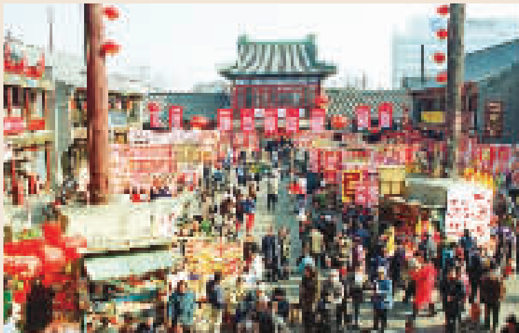
2000年 古文化街年货市场上,各种吊钱、窗花都贴满了货架,一片红红火火。在这里买年货已是天津的“年俗”了。