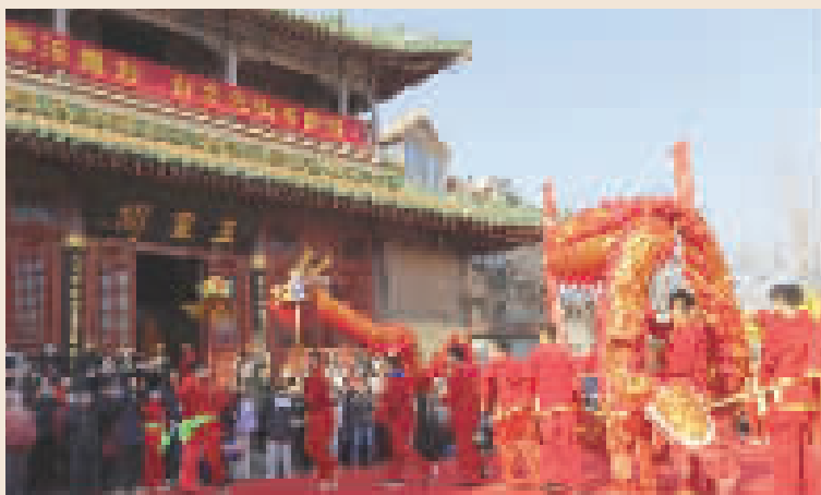
2023年 正月初九玉皇阁庙会,吸引了广大市民前往观看,很多喜庆吉祥的民俗活动正在恢复。