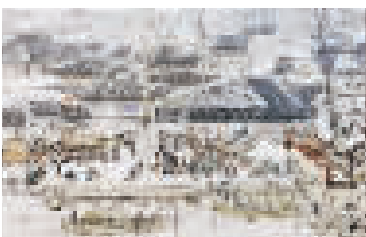
天后宫影壁上的沽上繁华