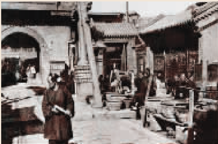
清末 天后宫卖金鱼的摊位。以之为中心的宫南宫北大街,也是天津早期的商业街道。