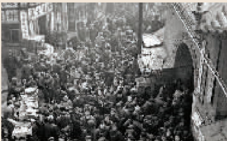
五十年代末 天后宫春节庙会景象。大人们逛得起劲,孩子们却被前广场上的小吃摊吸引住了。 资料图片