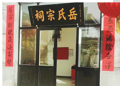
今年，岳氏宗祠将在正月十五举办祭祖仪式。

张艺谋执导的春节档电影版《满江红》，票房已破34亿。电影热映，引发了包括从电影到岳飞往事等一系列热议。在天津，有岳飞后裔达2万人，并且都是从静海区大瓦头村迁出的，而在当地，有一座岳氏宗祠，据说只比天津城“小几岁”。