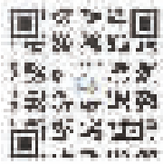
此二维码9月29日前有效

希望有选择婚房的地铁族积极参与话题互动,活动将筛选有见地的话题内容参与幸运抽奖。扫码添加微信即可参与互动。