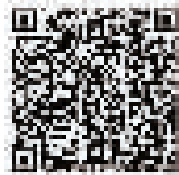
此二维码 9月29日前有效