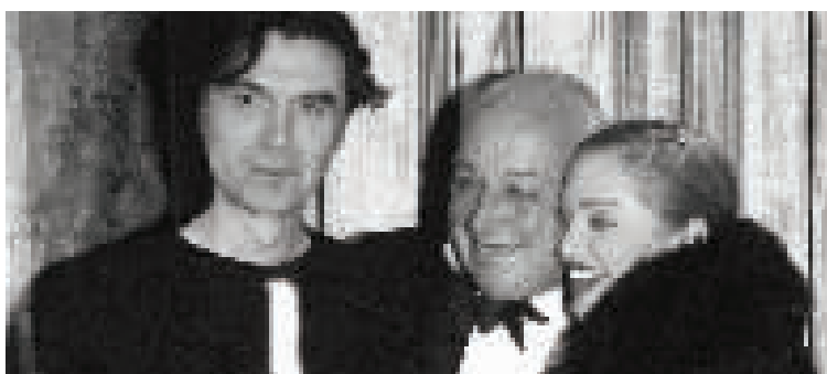
西摩·斯坦与ice-T戴维·伯恩、麦当娜在十四届摇滚名人堂颁奖礼上

BBC曾将西摩·斯坦誉为“最后一个伟大的唱片人”。西摩生于1942年，是“二战”一代，从出生起就笼罩在