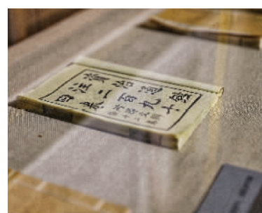
为书找一个安全所在，能时刻为己所用，也是梁启超选择天津意租界的原因之一。

在天津，梁启超特别爱给子女写信，更乐于握着梁思礼的小手给远在国外的儿女们写生活片段，甚至喜欢用梁思礼的语气。