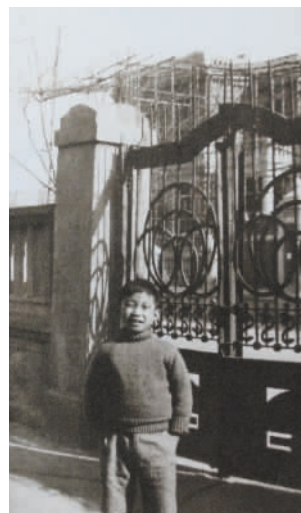
左图：2020 年，雨后的梁启超故居。右图：1936 年，梁思礼在饮冰室门前留影。时光如梭，留下了精彩的光阴故事。